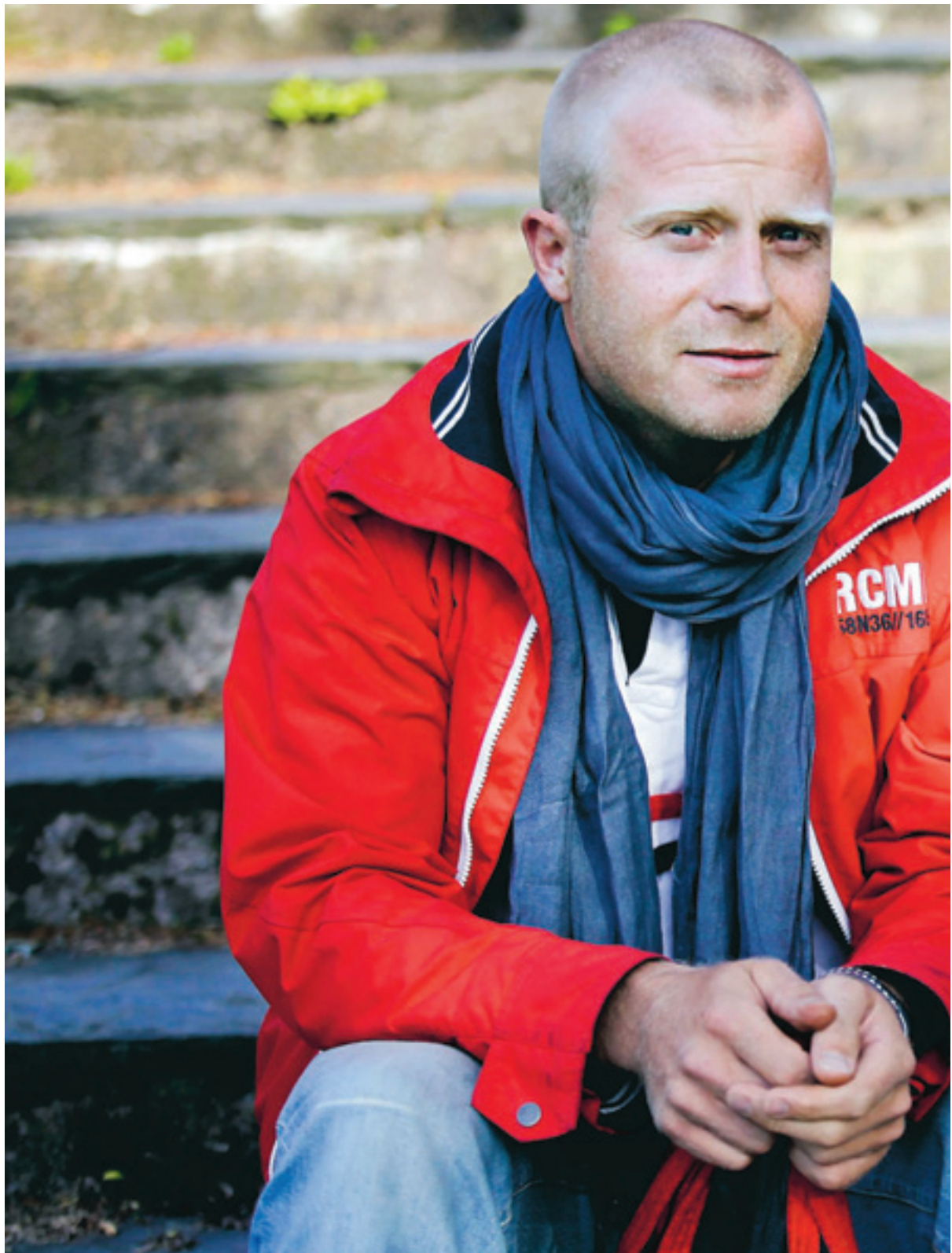
Efter skilsmässan hamnade Carl i en uppslitande vårdnadstvist som ännu inte är slut. Hans exfru anklagade honom

PEA NILSSON pea.nilsson@dn.se 08-738 17 07