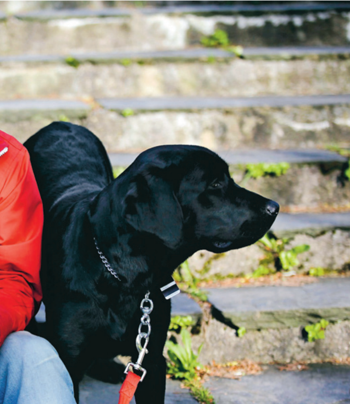
för våldtäkt, sexuella övergrepp på barnen och misshandel samtidigt som hon höll sig undan med barnen.